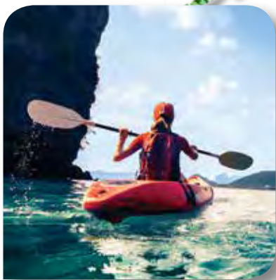
スポーツ・レジャー